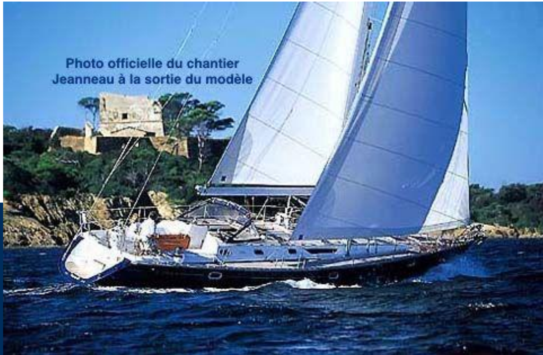
Photo officielle du chantier Jeanneau à la sortie du modèle