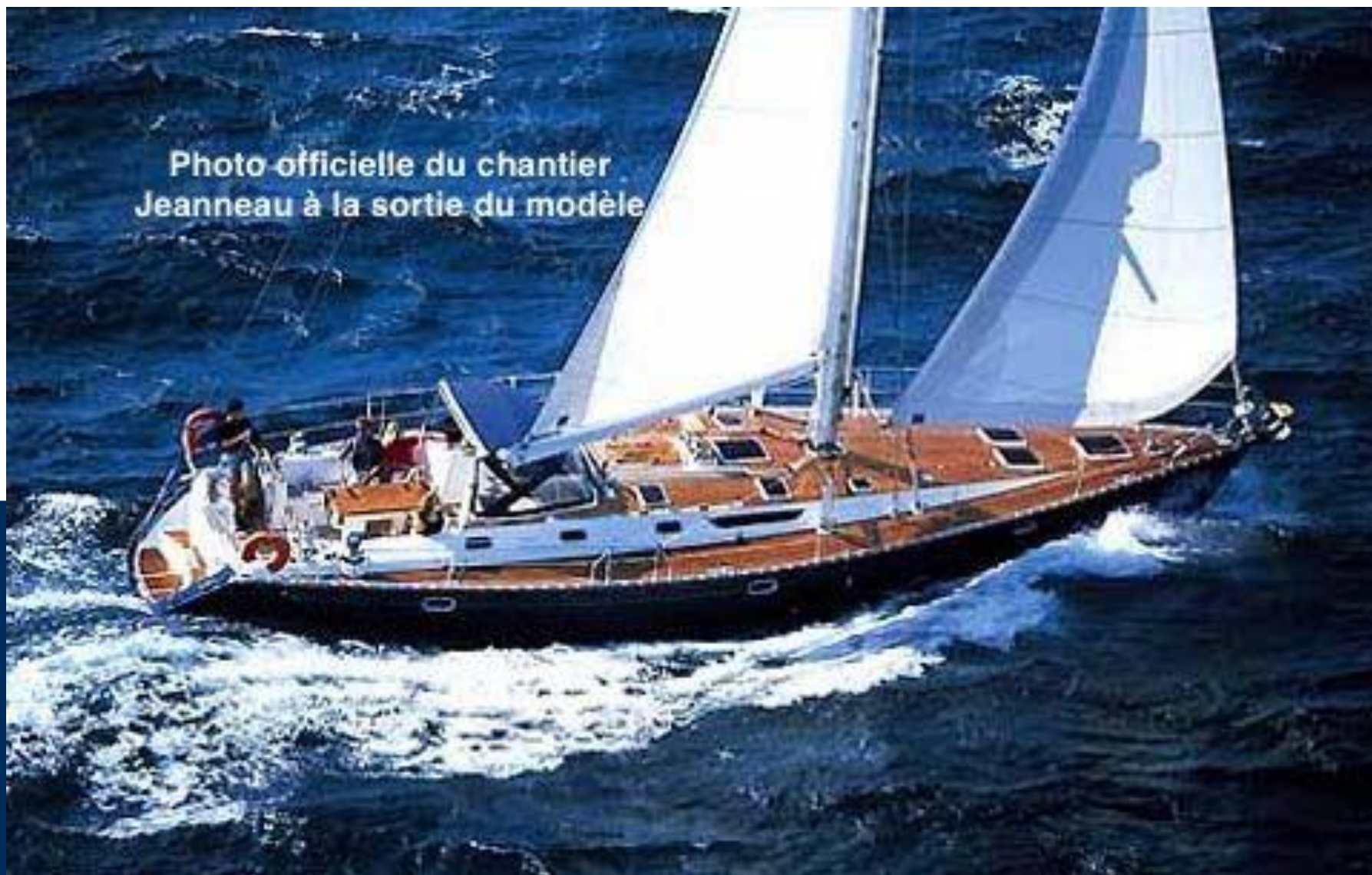
Photo officielle du chantier Jeanneau à la sortie du modèle